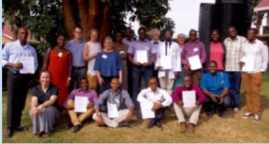
Diplômés et instructeurs du cours de formation des formateurs.