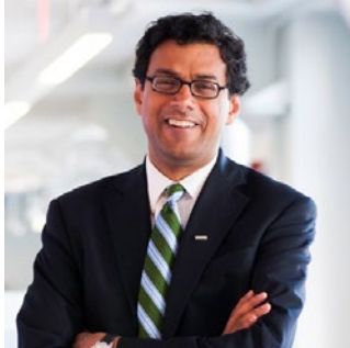
*Dr. Gawande will not receive any personal reward for speaking at this event.